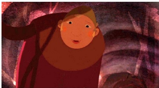
Der Oger (Der kleine Däumling)