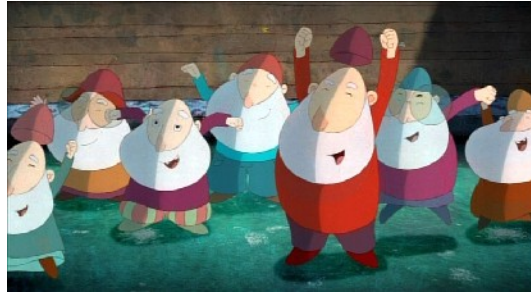
Die sieben Zwerge (Schneewittchen)