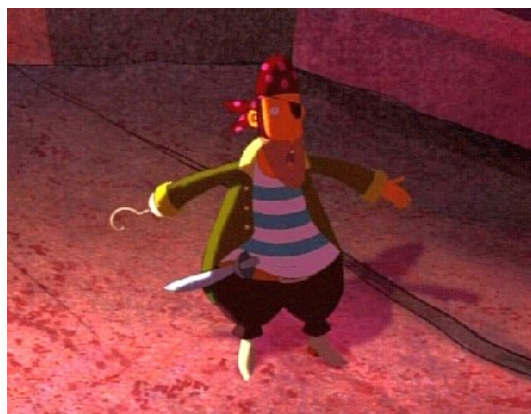
Käpt'n Hook (Peter Pan)