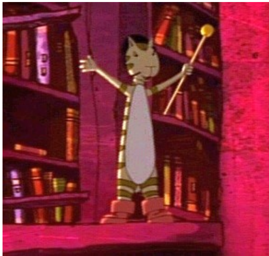
Der gestiefelte Kater (Der gestiefelte Kater)