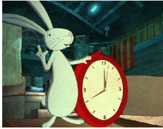
Der Hase (Alice im Wunderland)