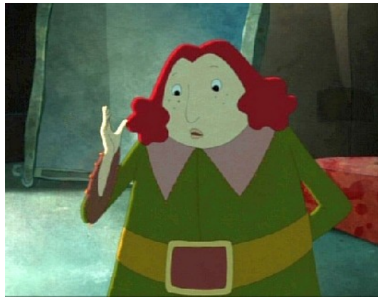
Gulliver (Gullivers Reisen)