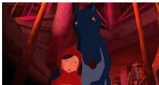
Rotkäppchen und der böse Wolf (Rotkäppchen)