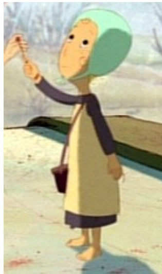
Das Mädchen mit den Schwefelhölzern (Das Mädchen mit den Schwefelhölzern)