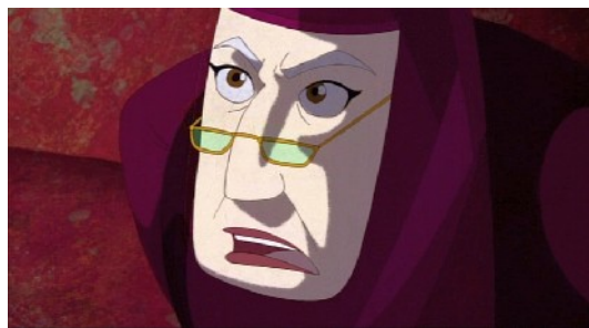
Die dreizehnte Fee (Dornröschen)