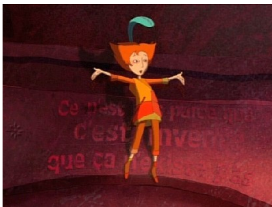
Peter Pan (Peter Pan)