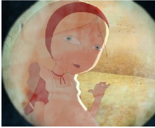
Alice (Alice im Wunderland)